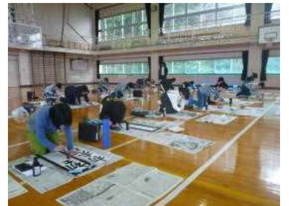
1・2年生は硬筆、3～6年生は毛筆に挑戦！みんな真剣な表情で書いています。

新春恒例の校内書き初め大会が、1月11日(水)に行われました。寒い中でしたが、全員集中して取り組み、真剣な表情で一文字一文字ていねいに書いていました。作品は、2階はまなすホールに展示し、学習参観時などにお家の方からご覧いただきました。子どもたちの作品の出来映えはいかがでしたでしょうか。