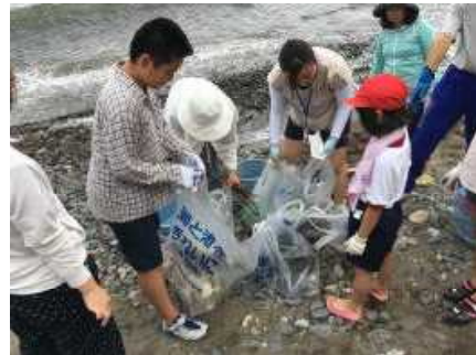
たくさんゴミを拾ったよ！

当日は、保護者ボランティアの方にも参加していただき、見違えるようにきれいな海岸になりました。