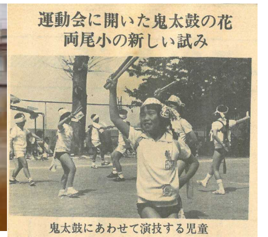
昭和54年7月 週刊「朝日だより」佐渡版