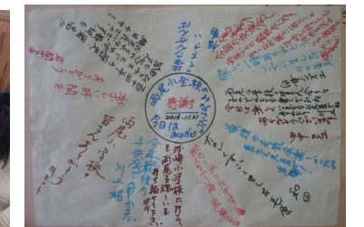
「寄せ書き」をいただきました